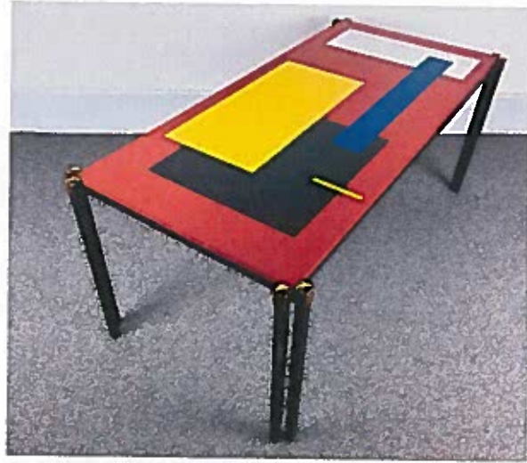
Fig. 3 – Fotografia de uma mesa com um padrão no tampo

A personalização de produtos é hoje uma forma de algumas marcas se destacarem pela qualidade do serviço personalizado que disponibilizam aos clientes. Noutras situações, as marcas optam por se diferenciar da concorrência recorrendo ao design gráfico ou à arte como aliados do Design de Produto. Saber escolher o género de imagem gráfica/visual a colocar no produto está associado à disciplina do Marketing que por sua vez, procura perceber quais são as tendências dos gostos dos consumidores.