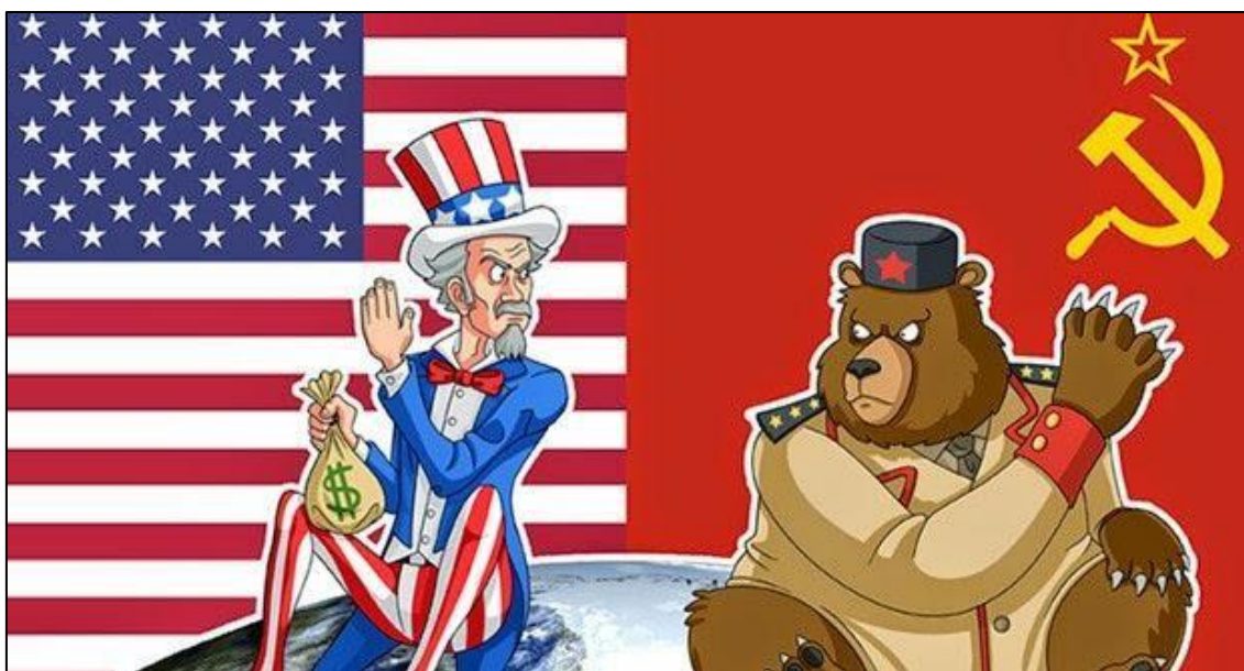
Documento 16: A divisão do Mundo

5.1. A partir dos documentos 15 e 16, caracterize a Europa e o Mundo, após a Segunda Guerra Mundial.