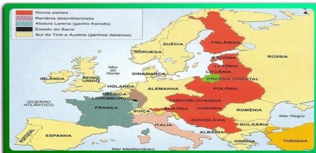
Documento 13: A Europa nas vésperas da II Guerra Mundial