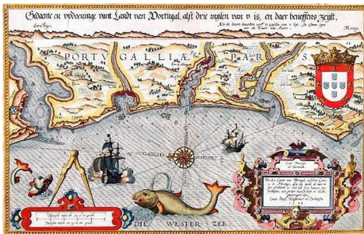
Documento 2: Carta de Lucas Janszoon Waghenaer 1583

1. Observe atentamente o seguinte documento.