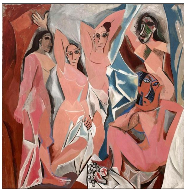
Documento 8: Pablo Picasso