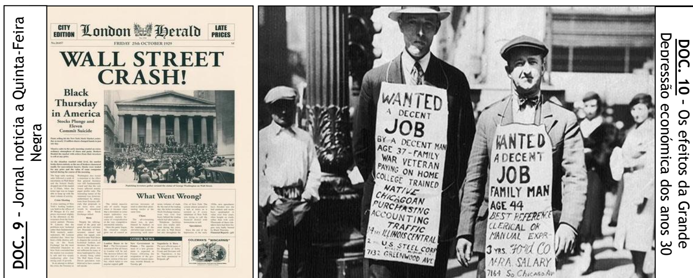
DOC. 9 - Jornal noticia a Quinta-Feira Negra

1. Examine cuidadosamente os seguintes documentos.