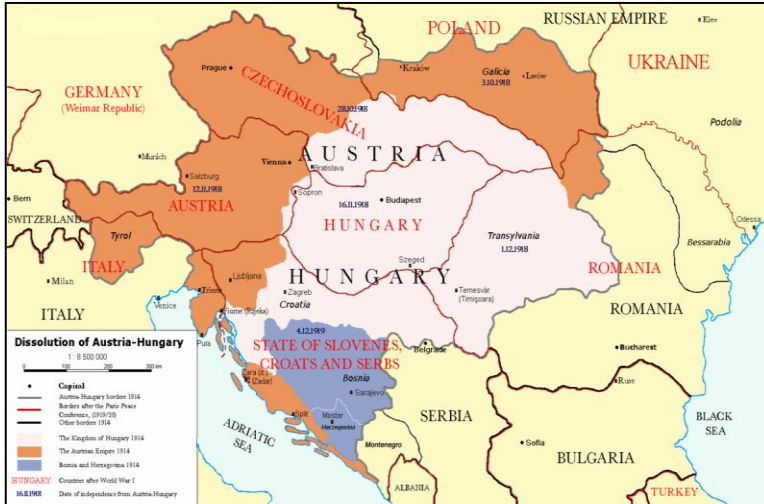
DOCUMENTO 7 - A Europa, após a primeira Guerra Mundial

2. Examine cuidadosamente os seguintes documentos.